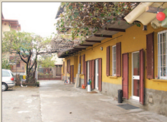
Sede di via per Monza