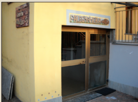
Sede di via Mozart