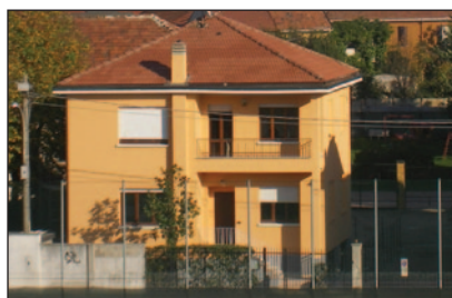
La Casa Famiglia di via Garibaldi a San Maurizio