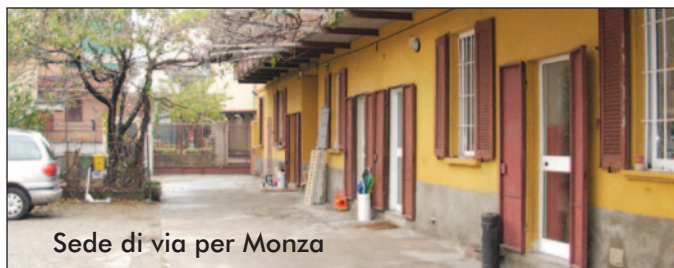
Sede di via per Monza

Codice Fiscale 94525300151 Conto Corrente Postale n° 41595208