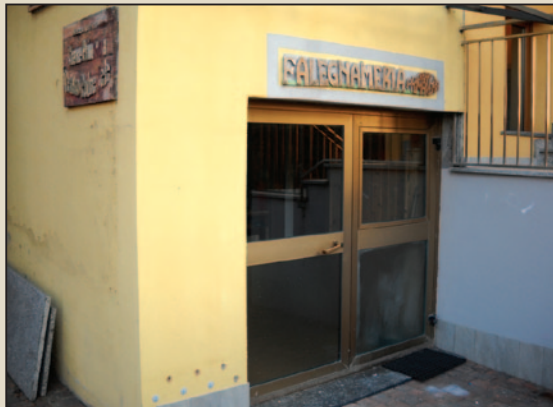
Sede di via Mozart